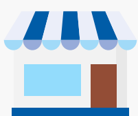
Poner un negocio