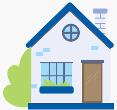
Comprar una propiedad